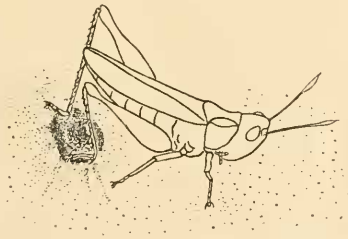
Abb. 2: G. rufus versucht, durch kurzschlägige Bewegungen den Vorderrand des Loches einzubrechen (Phase 1)

Die Eier sinken in ein schaumartiges Sekret; das Abdomen wird langsam aus dem Loch herausgezogen, ohne Mithilfe der Hinterbeine. Plötzlich schnurren die Segmente teleskopartig zusammen, der jetzt spitz gewordene Hinterleib verschwindet unter den Flügeln und gleichzeitig beugt sich das Weibchen nach vorne, sodaß es hinten steil in die Höhe ragt. Die jähe Verkürzung des Abdomens ist das Zeichen für den Beginn der Zukratzbewegungen der Hinterbeine. Bei dem nun folgenden Vorgang sind 3 Phasen zu unterscheiden: Phase 1: kleinschlägige, stampfende Bewegungen, auf den Vorderrand des Loches beschränkt (Abb. 2). Das Weibchen versucht mit den Tarsen, in der Richtung von vorne nach hin-